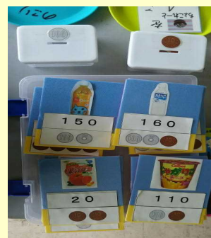
算数の教材 【お金の学習】