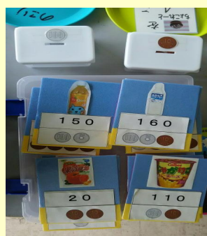
算数の教材 【お金の学習】